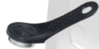
AT-32B – Tag de Identificación personal