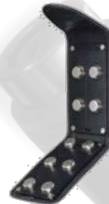
GA-02 – Billetera de Eventos