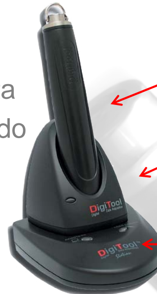
GC-01 Bastón de lectura