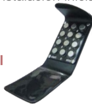
GA-12 – Billetera de Eventos numéricos