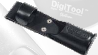
GA-06 – Funda de cuero para GC-01