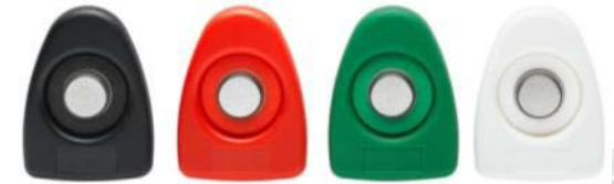
GA-01 – Tag de localización